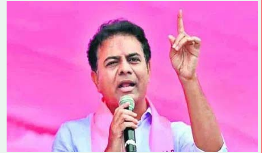
అసలు నిజమేంటి అంటే..?

ప్రతిఘటన, హైదరాబాద్ : తెలంగాణ రాజకీయాల్లో మాజీ మంత్రి కేటీఆర్ తీరు ఇప్పుడు హాట్ టాపిక్ గా మారింది. రేవంత్ సర్కార్ పై నిత్యం బురద చల్లడమే లక్ష్యంగా ఆయన చేస్తున్న వ్యాఖ్యలు ఇప్పుడు ఆయనకే ఎదురుదెబ్బ తగులుతున్నాయి. హైదరాబాద్ వేదికగా మీడియాతో మాట్లాడిన కేటీఆర్.. ఒకే అంశంపై రెండు భిన్నమైన మాటలు చెప్పి సోషల్ మీడియాలో నెటిజన్లకు అడ్డంగా దొరికిపోయారు. ప్రభుత్వం చేస్తున్న అభివృద్ధి పనులను అడ్డుకోవడంతో పాటు ప్రజల్లో అయోమయం సృష్టించేందుకు ఆయన ఫేక్ ప్రచారాన్ని నమ్ముకున్నారనే విమర్శలు వెల్లవెత్తుతున్నాయి. హైదరాబాద్ లోని మధు పార్క్ అపార్ట్ మెంట్స్ అంశంపై కేటీఆర్ మాట్లాడిన తీరు కొంత విస్మయానికి గురి చేసింది. ప్రసంగం ప్రారంభించిన రెండు నిమిషాల వ్యవధిలోనే ఆయన తన మాటలను మార్చుకున్నారు. మొదట మాట్లాడుతూ.. "మధు పార్క్ అపార్ట్ మెంట్లను కూల్చివేసి అక్కడ గాంధీ విగ్రహం కడతారు" అని ఆరోపించారు. సరిగ్గా రెండు నిమిషాల తర్వాత అదే నోటితో.. 'అక్కడ అపార్ట్ మెంట్లను కూల్చి వైవ్ స్టార్ హోటల్ నిర్మిస్తారు' అంటూ మరో బాబులు పేల్చారు. ఒకే వేదికపై ఒకే అంశం గురించి పొంతన లేని వ్యాఖ్యలు చేయడంతో కేటీఆర్ నిజ స్వరూపం బయటపడిందని బయట జనాలు మాట్లాడుకుంటున్నారు.